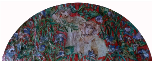
Jessica Balistreri Pigmenti e Primal su carta 25 x 55 cm. 2013