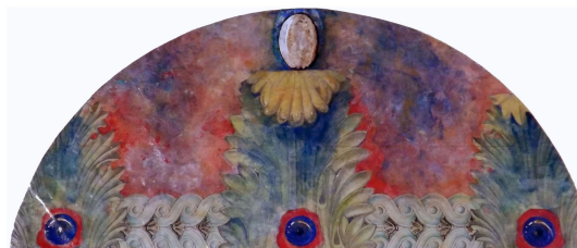
Giorgio Macaluso pigmenti e primal su carta 25 x 55 cm. 2013