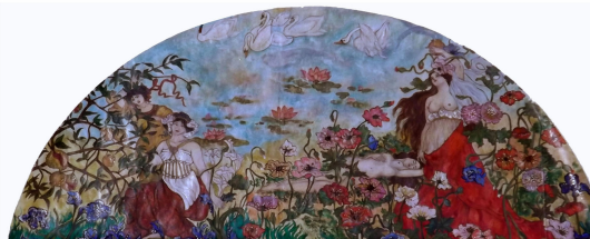
Valentina Magro pigmenti e primal su carta 25 x 55 cm. 2013